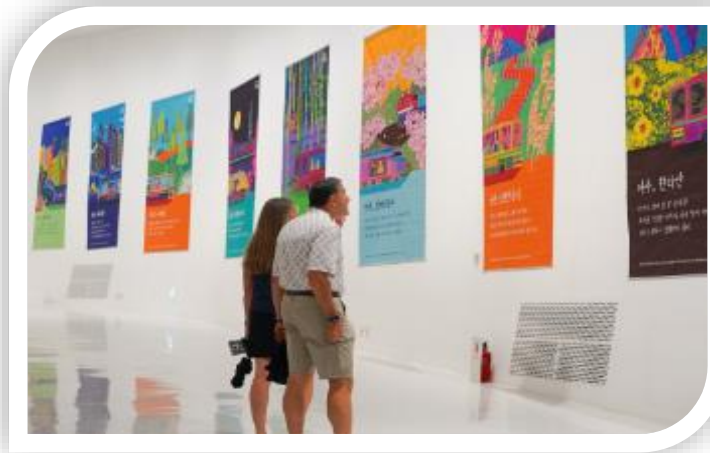
교통약자 대중교통 이용 배려 문화조성 사업 발달장애인 디자이너와 전시회를 개최하여 교통약자를 배려하는 대중교통 이용 문화 조성 및 인식 개선