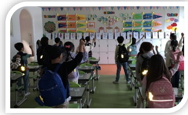
어린이 교통안전 캠페인 사업 서울시 초등학교생에게 반사뱃지(옐로우카드)를 지원하여 어린이 등·하교 보행 중 교통사고 예방