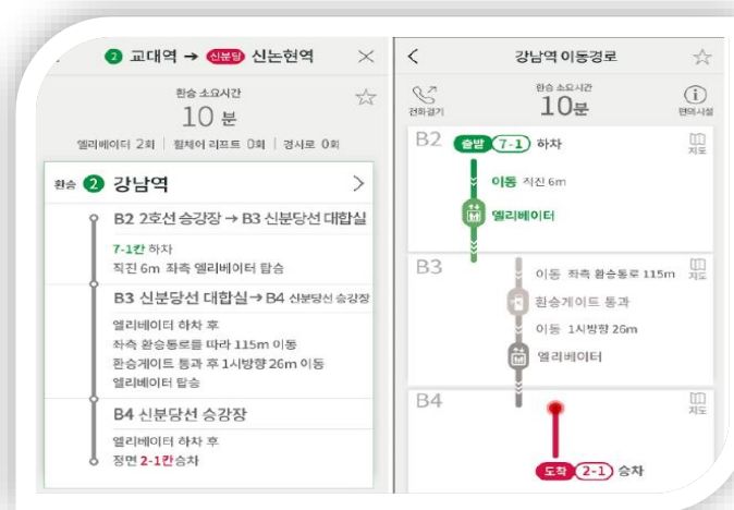
교통약자 지하철 환승지도 제작 지원사업 휠체어 이용자 및 교통약자가 지하철에서 원활히 이동할 수 있는 지하철 환승지도 제작