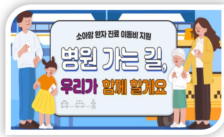
소아암 환자 진료 이동비 지원사업 19세 이하 소아암 진단을 받고 치료중인 환자 및 환자 가족의 병원 이동 교통비 지원